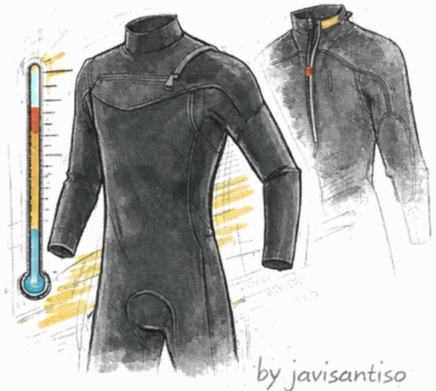
TABLA DE TEMPERATURAS